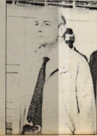
M. Diğerdem Barış Derneği Davası'nın bir duruşmasında.