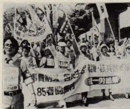
Tokyo'da barış yürüyüşü.

Yargılama 20 Kasım 1945'de başladı. Sanıklardan Hitler, Himmler ve Goebbels daha önce, Göring ve Ley, dava sırasında intihar ettiler. Mahkeme Ribbentrop, Keitel, Kaltenbrunner, Rosenberg, Frank, Frick, Streicher, Jodl, Seyss Inguet'a ölüm cezası verdi ve bu cezalar 16.10.1946'da infaz edildi. K.Neurath, K.Dönitz, E. Raeder, A.Speer, B.Von Schirach, R.Hess ömür boyu hapse mahkum edilerek Spandau'ya sürgüne gönderildiler. Bunlardan R.Hess dışında kalanlar zamanla serbest bırakıldılar. Mahkemenin uluslararası niteliğine rağmen, Göring davası dışında kalan 12 dava ABD'liler tarafından yürütüldü. Öngörülen aksine davalar, Nasıyonal Sosyalist Partisi siyasi yöneticileri yerine, subay, hukukçu, sanayici ve memurlara yöneltildi. Fransa (Manstein Davası) ve İngiltere de aynı yolu seçtiler. F.Alman mahkemelerinin o zamanlar Naziler hakkında verdikleri kararların hemen hiçbirini infaz edilmedi, uygulanmadı.