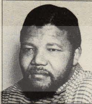
ANC lideri Nelson Mandela

Güney Afrika özgürlük hareketinin sembolü ve Afrika Ulusal Kongresi (ANC) lideri Nelson Mandela'nın prostat kanseri olduğu açıklandı. 67 yaşında ve 23 yıldır hapiste olan Mandela'nın doktorları hastalığın böbrek ve akciğerlere de yayıldığını açıkladılar. Eşi Winnie Mandela kocasının, kendi seçeceği bir doktor tarafından muayene edilmesi istemekle onun G.Afrika'daki bağımsızlık ve özgürlük hareketi uğruna hapiste yatışını ve gerekirse bu amaç uğruna ölmeye hazır bulunduğunu belirtti.