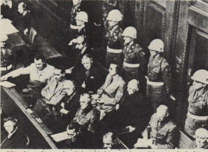
Nürnberg Savaş Suçluları Mahkemesi sanıkları toplu halde.