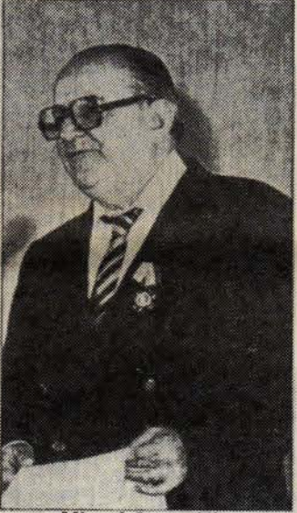
Miguel Otero Silva

Venezuelalı gazeteci ve yazar Miguel Otero Silva 28 Ağustos'ta öldü.