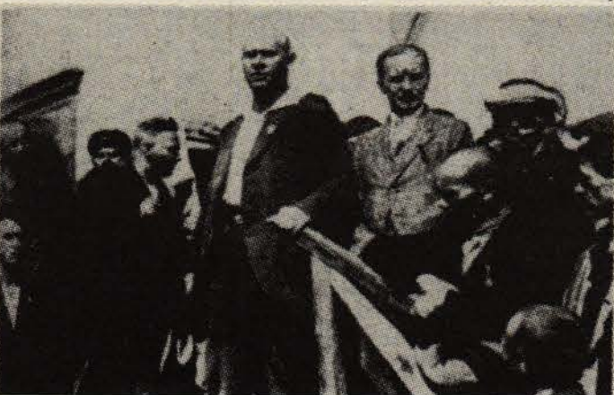
Ernst Thälmann, 27 Haziran 1929'da Leningrad'da toplanan Komünist Enternasyonal'in İcra Komitesi'nin 10. oturumundan sonra.

Thälmann 1925 yılında yapılan cumhurbaşkanlığı seçimlerinde 1.9 milyon oy aldı. Seçim çalışmaları sırasında Almanya'nın her kesiminden milyonlarca işçi onu yakından tanıma fırsatı edindi ve kendi dillerinden konuşan bu öndere duydukları güvenin haklılığına bir kez daha inandı. Böylece Thälmann KPD'nin en popüler liderlerinden biri oldu ve 1925 sonbaharında yapılan kongrede partinin başına geçti.