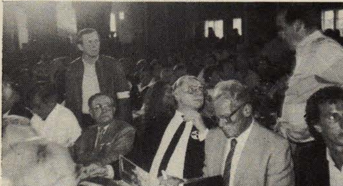
Münih toplantısında davetli olan SPD Genel Başkanı Willy Brandt (sağdan ikinci).

nen Willy Brandt daha sonra, savaşa ve silahlanmaya karşı olduklarını, silahlanma için harcanan milyarlarca doların insanlığın geleceği için kullanılması gerektiğine değindi. Dünya barışının SSCB ve ABD tarafından karşılıklı anlaşmalarla korunabileceğine inandığını belirten Brandt, konuşmasını "Her kim ki, barıştan yana, silahsızlanmadan yana herhangi bir çaba sarfetmiyorsa onların insanlığından, hümanistliğinden şüphe ederim. Tüm insanlığı barış için çaba sarfetmeğe çağırıyorum." diyerek konuşmasını bitirdi.