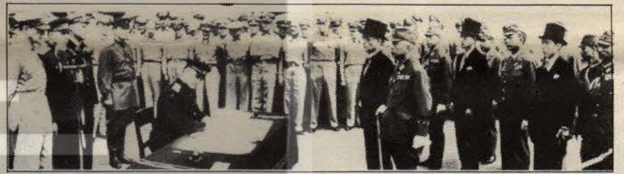
Japon militarizminin yenilgisiyle sonuçlanan Uzakdoğu'daki savaş noktalanıyor.

Aradan geçen kırk yıl sonra Japonya, askeri görevlerini ihmal ettiği gerekçesiyle ABD tarafından suçlanmasına rağmen, halen dünyada en çok askeri harcama yapan ülkeler sıralamasında birçok NATO ülkesinin önünde, 8. sırada yer almaktadır. Washington'daki Savunma Enformasyon Merkezi tarafından yayımlanan "The Defence Monitor" dergisinin 1/1984 sayısında saptanan Japon politikasının diğer göze çarpan noktaları şunlardır: ABD, Sovyetler Birliği ile yapılabilecek bir savaşta kendisine destek olmak için Ja-